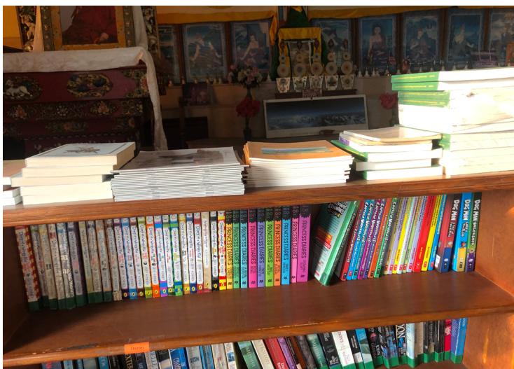
Achat de livres en tibétains et en anglais pour une école tibétaine de Katmandou