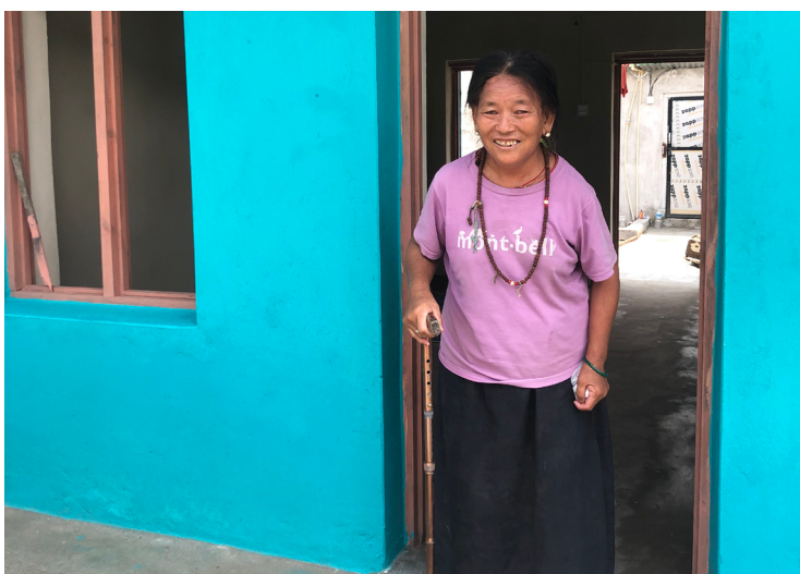
Réfugiée tibétaine bénéficiant d'un logement rénové