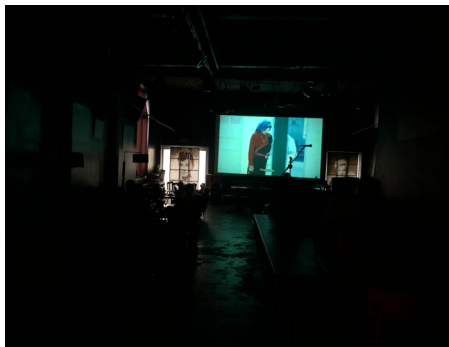
Film « Balloon » au Café Cinéma de Vianden