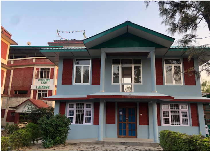
Construction d'un logement pour jeune adultes à besoins spéciaux, anciens élèves, dans le TCV de Chauntra