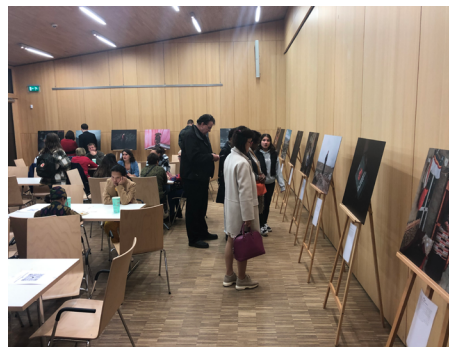
Exposition « From Tibet to Nepal »