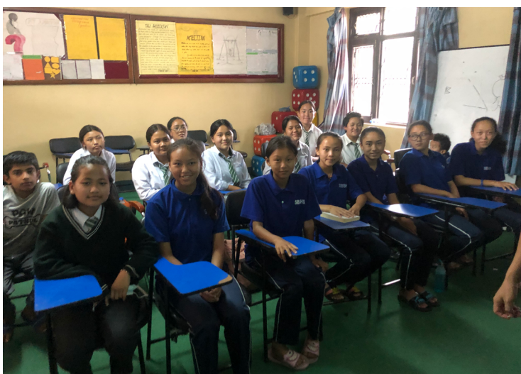
Éèves participant à une formation extrascolaire organisée par Karuna