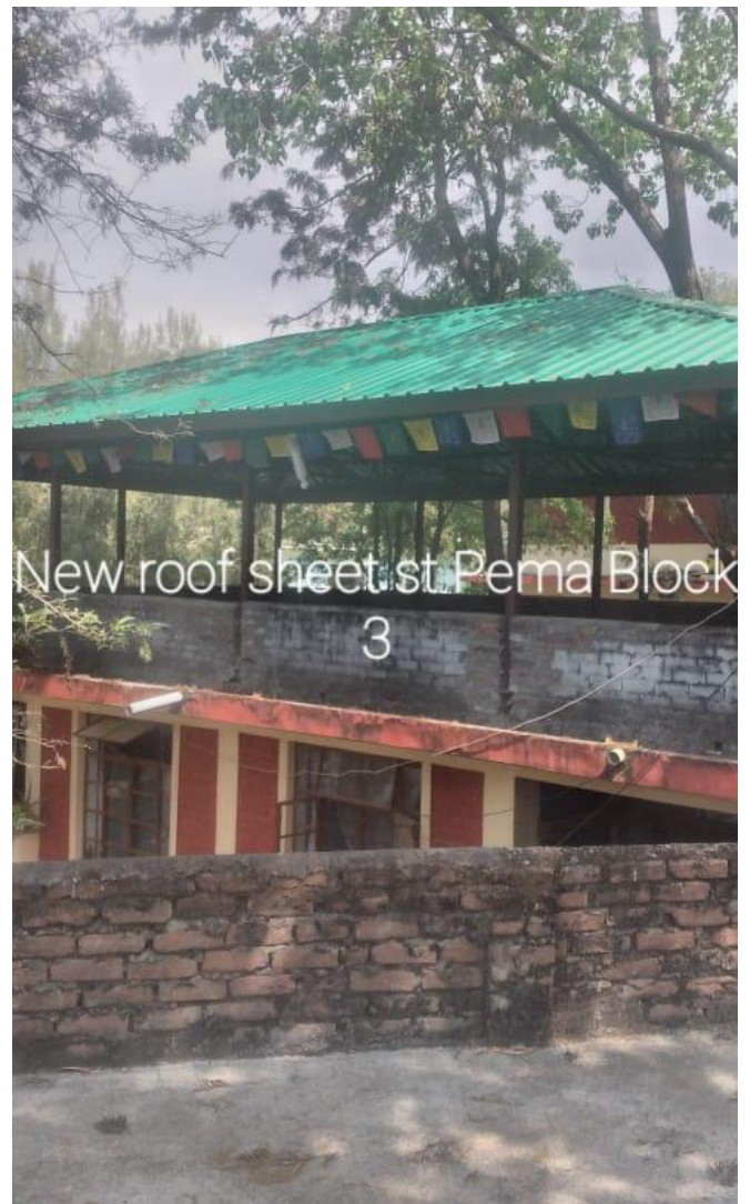
Installation de toit en tôle sur plusieurs logements dans les TCV de Gopalpur et Suja