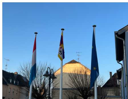
Opération drapeaux à Berdorf