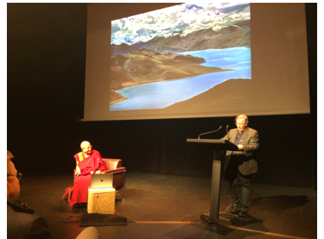
Conférence de Matthieu Ricard