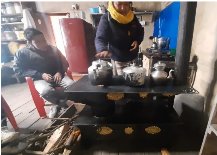
Installation de poêles à faible consommation dans un village tibétain du Mustang