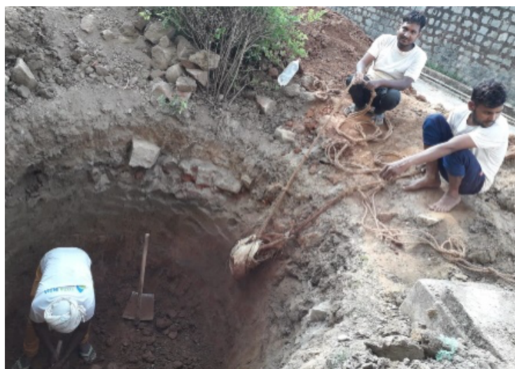
Préparation d'un emplacement pour fosse septique à Suja