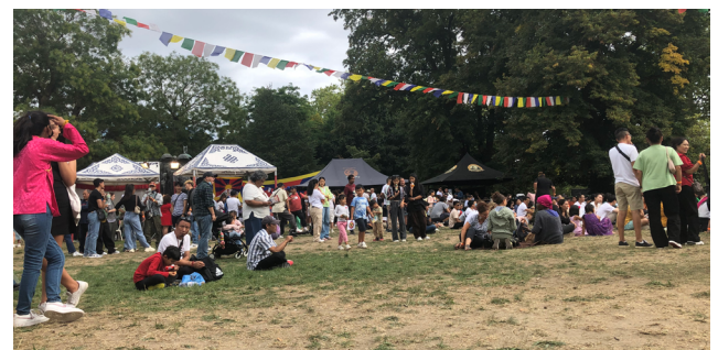
Visite du festival Tibet organisé chaque année à Paris au mois de septembre