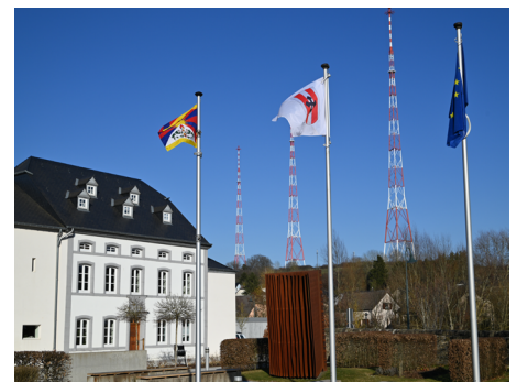
Opération drapeaux à Junglinster