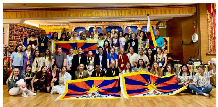
Photo de groupe lors de la rencontre européenne d'ITN à Barcelone