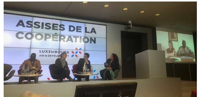
Assises de la coopération organisée par le Cercle des ONG et le MAEE