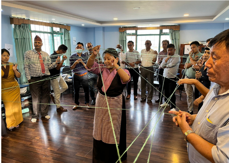
Formation SEE Learning organisée pour les enseignants des écoles TCV