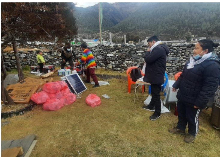
Installation d'éclairage solaires dans un village tibétains isolé du Népal