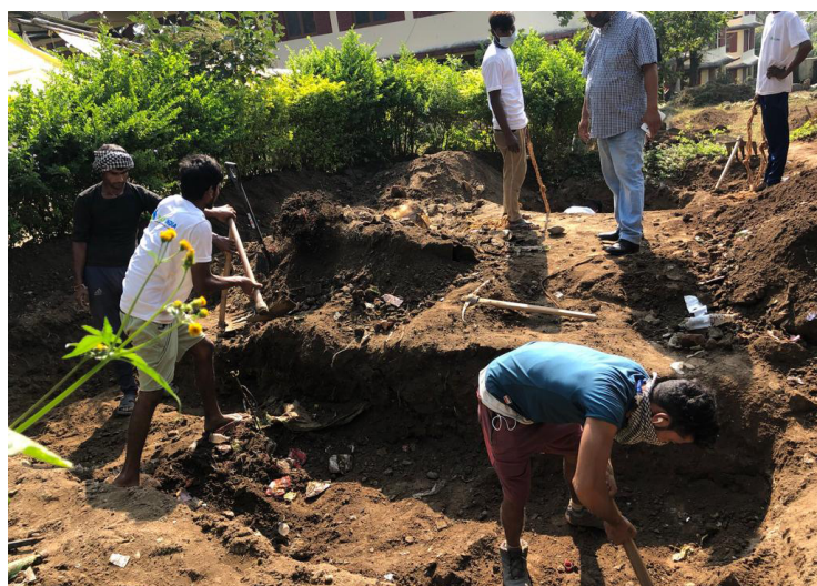
Installation d'un système d'évacuation des eaux usées à Chauntra