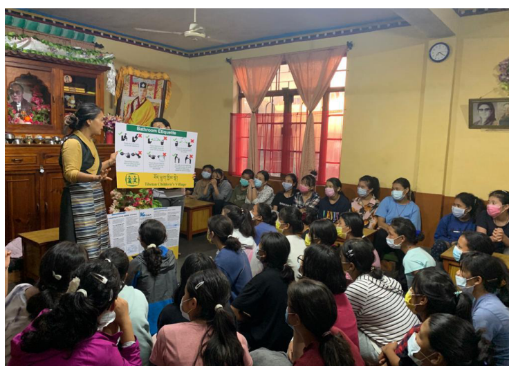
Sensibilisation des élèves à la gestion de l'eau et à la bonne utilisation des sanitaires avec fosses septiques