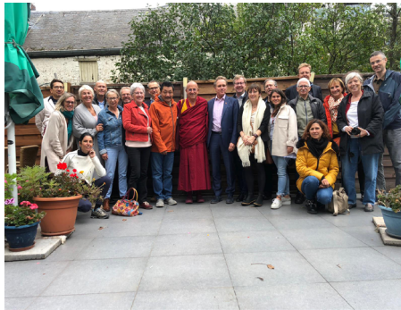
Rencontre avec Matthieu Ricard