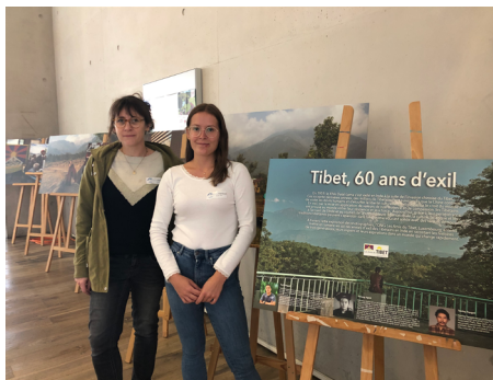
Exposition à l'école européenne de Mamer