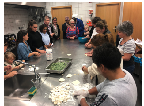
Atelier momo dans le cadre du Festival Nepal