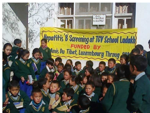
Screening au TCV Ladakh

Diddeleng Helleft et Actions Sans Frontières des Ecoles européennes ont soutenu ce projet.