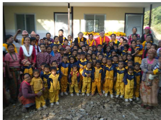
Ecoliers posant devant leur école