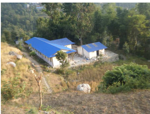
Ecole et toilettes reconstruites après le séisme

En 2016, 10 écoles primaires de villages reculés ont été réhabilitées et accommodées de toilettes. Un millier d'élèves ont reçu des uniformes et des fournitures scolaires. Ce projet s'est terminé le 31 décembre 2016. Une mission de suivi a eu lieu en novembre 2016.