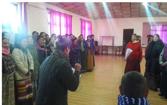
Atelier de formation pour les home mothers

Ce projet est dans sa 2 ème année. Les principales activités réalisées sont : la modernisation de l'équipement scolaire ; le développement d'activités extrascolaires ; la formation des enseignants à de nouvelles pratiques pédagogiques ainsi que le renforcement des capacités des encadrants ( home mothers ) et du staff administratif ; la rénovation des voiries sur le campus, des cuisines des homes ainsi que des logements qui accueillent les enfants âgés de 5 à 14 ans.