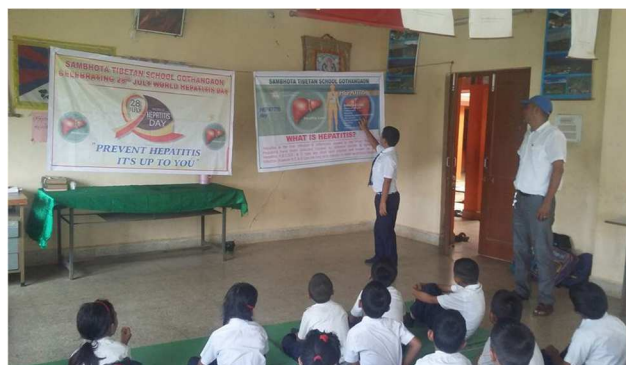
Séance de sensibilisation