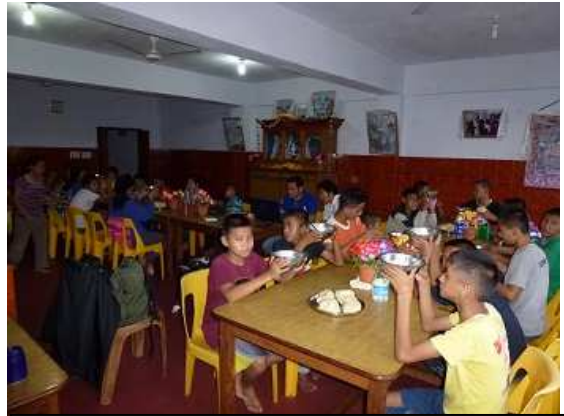
Le moment du repas à l'école de Chauntra (2011)