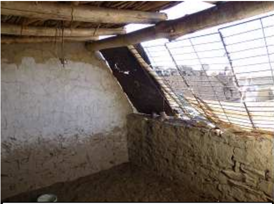
Vue intérieure d'un abri pour animaux

Notre partenaire pour ce projet est le ministère tibétain du logement ( Department of Home ). Le froid intense qui règne dans cette région (les températures hivernales descendent jusqu'à -45^{\circ}\text{C} ) fait mourir chaque année de nombreux animaux jeunes et fragiles avant le printemps. Ce projet vise à aider les Tibétains semi-nomades réfugiés dans cette région à préserver leur mode de vie traditionnel, le bétail étant généralement leur unique source de revenus , et contribue à limiter l'exode rural de ces populations.