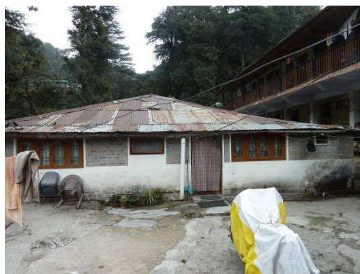
Bâtiment à démolir en vue d'y construire le nouveau « student center » (photo de Pierre Baumann, février 2013)

2. En dehors des heures de cours, les élèves bénéficieront du centre et de toutes ses commodités (salles mais surtout matériel comme le projecteur, les micros, etc.) pour se retrouver et mener à bien leurs projets, mais aussi suivre les formations proposées par les volontaires venus de différents pays (atelier photo, vidéo, etc.).