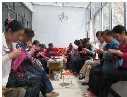
Formation à la confection de chaussons

Les femmes bénéficiaires ont également pu développer des compétences en agriculture, environnement, couture et coiffure , ce qui constitue de nouveaux savoir-faire potentiellement générateurs de revenus.