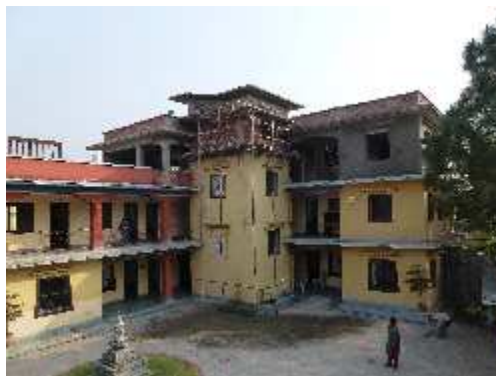
La fabrique de médicaments tibétains en cours de construction (photo de Monique Paillard, 2012)

ancestrale menacée au Tibet. La médecine tibétaine est une médecine à part entière, qui permet de guérir certaines maladies incurables avec la médecine occidentale. Cette clinique offre des soins gratuits aux pauvres et des services inexistantes ailleurs tels que l'éducation sanitaire, l'éducation nutritionnelle, un service de planning familial et une unité de soins palliatifs.