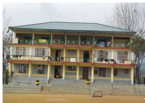
Le bâtiment de dortoirs vu de face (photo de Pierre Baumann, février 2013)

Le chantier s'est achevé courant 2012. Ce nouveau bâtiment de 3 niveaux accueille des dortoirs pour 188 garçons , ainsi qu'un réfectoire . Grâce à ce projet, les élèves bénéficient à présent de plus d'espace pour dormir, de toilettes et de salles d'eau, etc. Leurs conditions de vie s'en trouvent grandement améliorées !